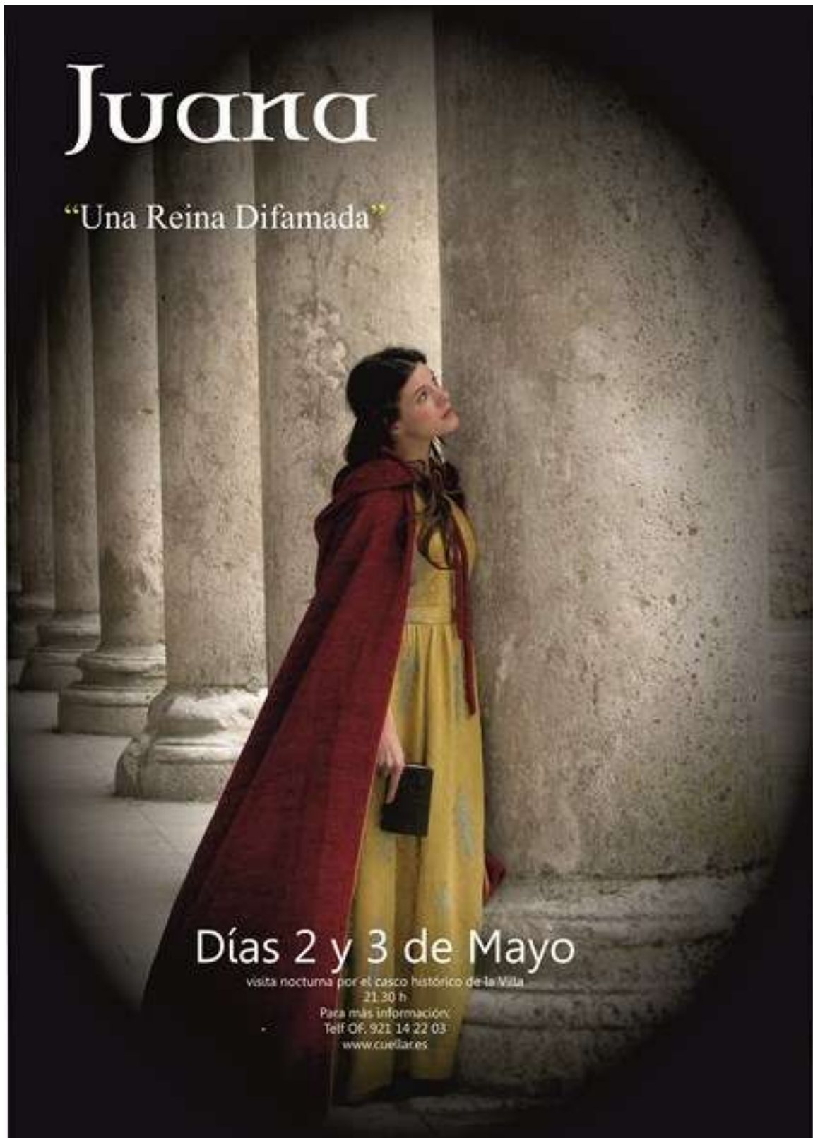
Cartel de la visita nocturna teatralizada por Cuéllar