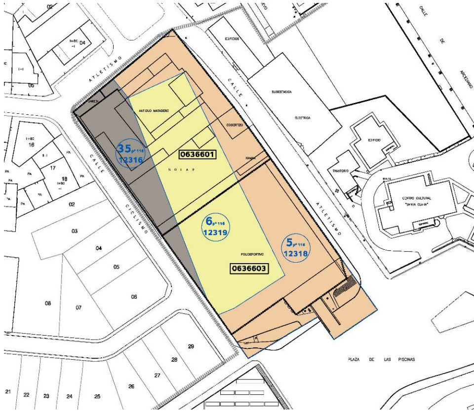
2. Esquema de superposición sobre el levantamiento topográfico de la cartografía catastral actual y antigua.