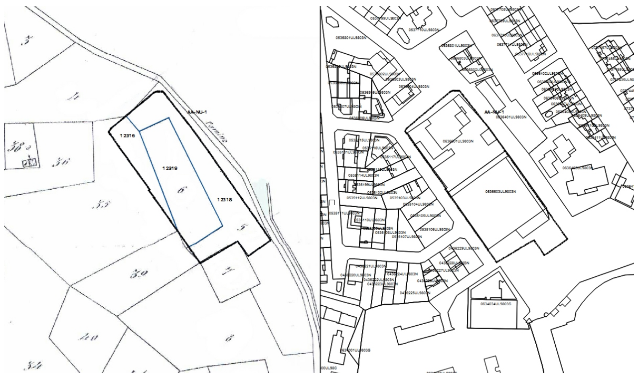
1. Planos del Antiguo Catastro de Rústica y Catastro Actual.

Se acompaña la siguiente documentación: el plano del Antiguo Catastro de Rústica, el del Catastro actual, el esquema de superposición sobre el levantamiento topográfico de la cartografía catastral actual y antigua, explicativo de ambas realidades y, por último, el listado del extinto Instituto Geográfico y Catastral relativo a las parcelas afectadas del Antiguo Catastro de Rústica, donde se expone su caracterización física y jurídica.