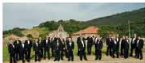
Coro Polifónico "Voz del Pueblo" de Guarnizo (El Astillero - Cantabria)