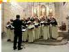
Coral Mirobrigense "Dámaso Ledesma" (Ciudad Rodrigo - Salamanca)