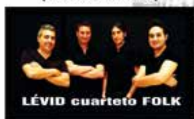
LÉVID cuarteto FOLK (Valladolid)