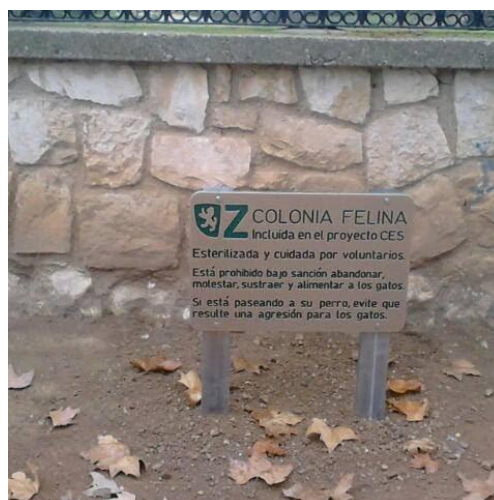
Ilustración 2. Ejemplo de cartel señalizando una de las colonias felinas incluidas en el proyecto C.E.S. de Zaragoza.

La colocación de los carteles se realizará según el criterio de los cuidadores de cada colonia en concreto, por ser conocedores de la situación de la colonia y su entorno, siempre consensuado con el Ayuntamiento y con la asociación.