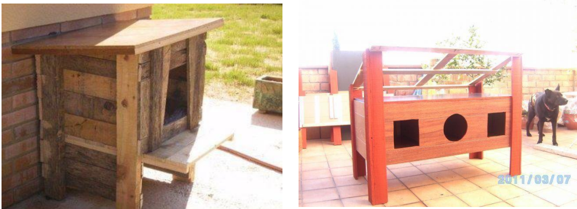
Ilustración 3. Ejemplos de refugios hechos con madera reciclada