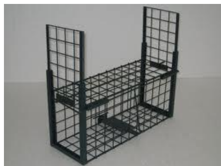
Ilustración 9. Ejemplo de jaula/trampa.

Para la realización de capturas y esterilizaciones se necesitará contar con jaulas trampa que se cierren una vez que el gato entra en ellas, como la de la imagen a