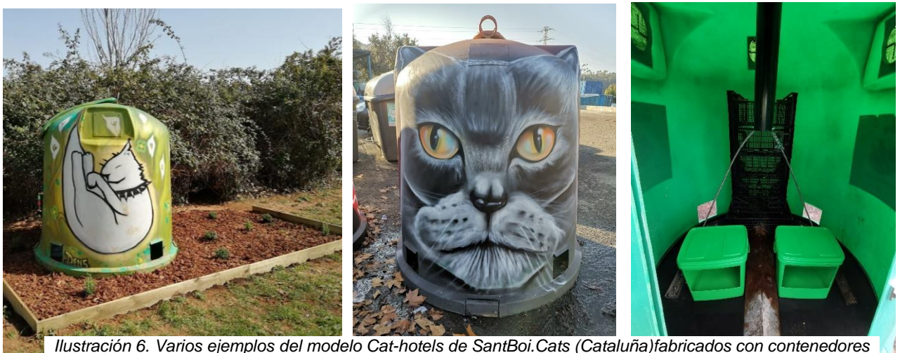
Ilustración 6. Varios ejemplos del modelo Cat-hotels de SantBoi.Cats (Cataluña) fabricados con contenedores de vidrio.