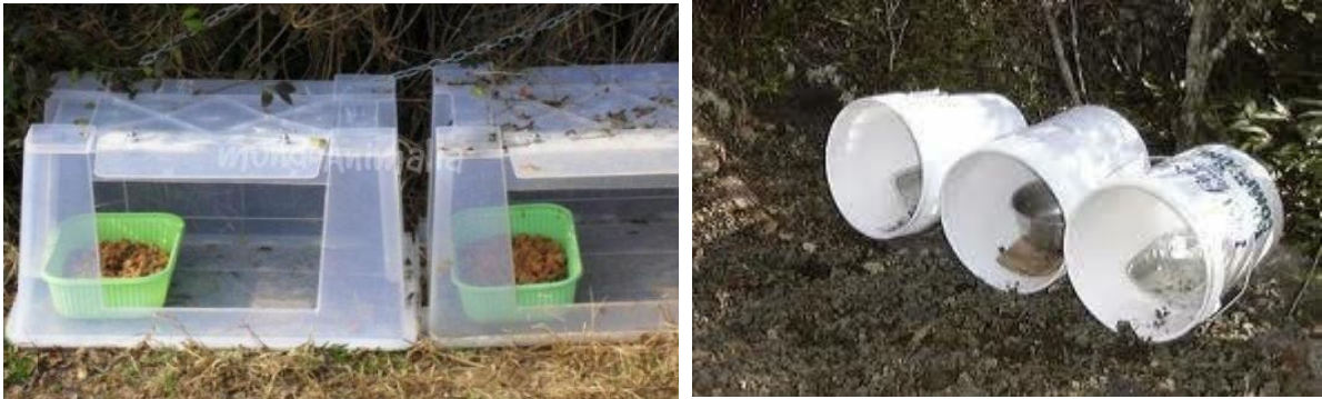
Ilustración 5. Ejemplo de estación de alimentación con cajas de plástico (izquierda) y con bidones (derecha)

Las siguientes imágenes muestran ejemplos de este tipo de instalaciones: