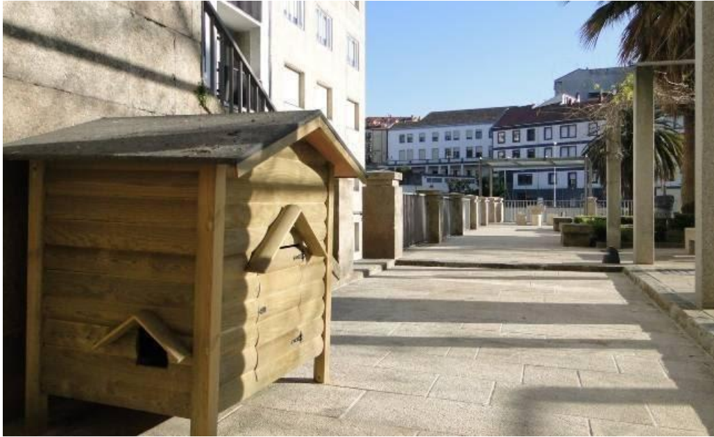
Ilustración 7. Ejemplo de refugio para gatos realizado con madera por el Ayuntamiento de la ciudad de Ourense.