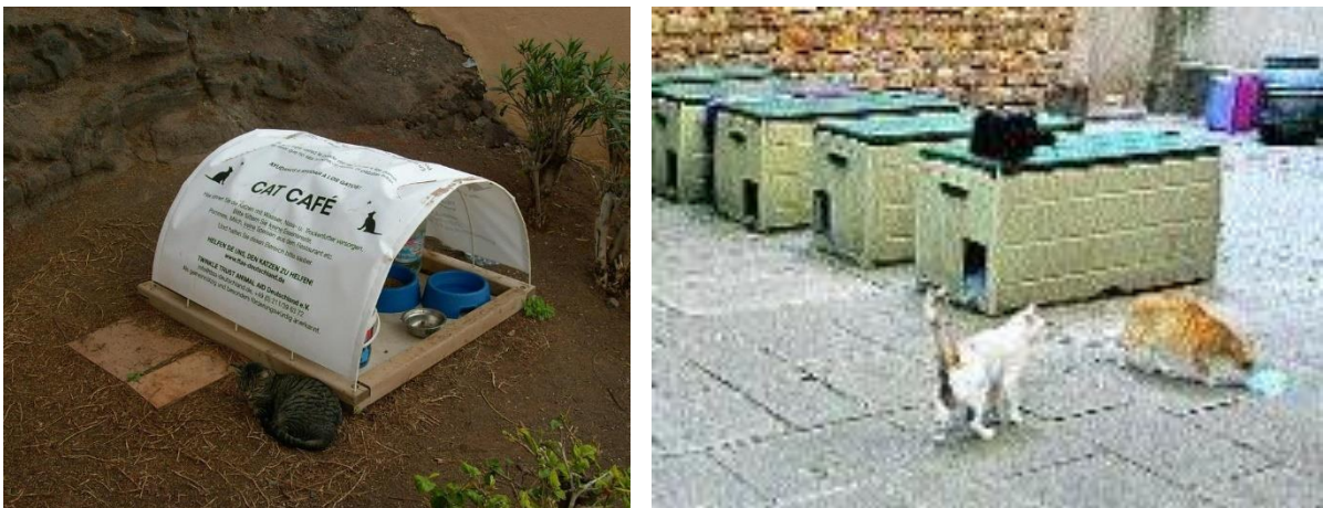
Ilustración 4. A la izquierda: estación de alimentación realizada con plástico y madera que evita que se moje la comida. El plástico hace las veces de cartel explicativo. En la derecha: ejemplo de refugios realizados con arcones de resina.