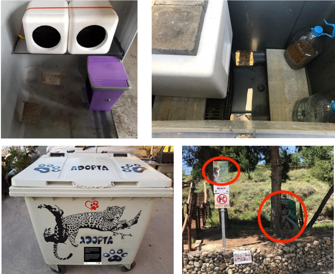
Ilustración 8. Ejemplo de cat-hoteles promovidos por SantBoi.Cats (Cataluña) y CER Cascante (Navarra)

El Ayuntamiento de Cuéllar se compromete a poner en conocimiento de su personal de limpieza urbano que estas instalaciones no deben ser retiradas y a señalizarlas para que sean respetadas por los vecinos. Los cuidadores revisarán periódicamente el estado de estas instalaciones y notificarán cualquier desperfecto. El Ayuntamiento se encargará de repararlas o sustituirlas por otras de igual o mayores prestaciones.